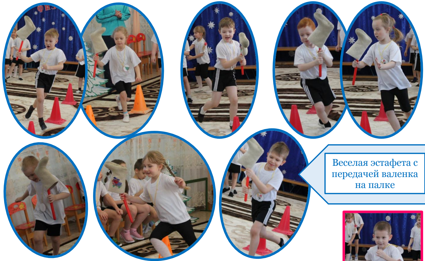
Веселая эстафета с передачей валенка на палке