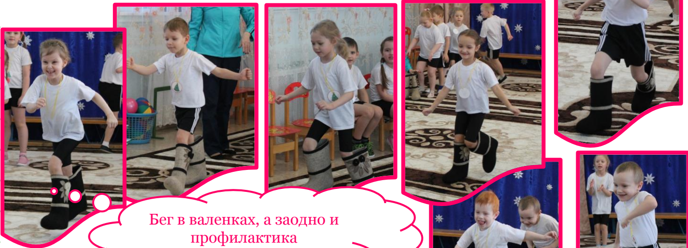
Бег в валенках, а заодно и профилактика простудных заболеваний