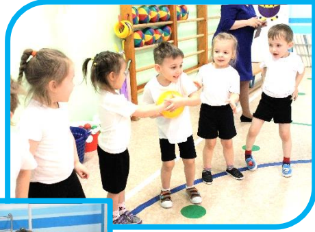
Мячик «змейкой» я качу, Никуда не отпущу!