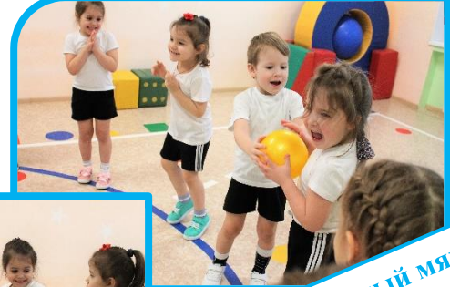
Ты катишь веселый мячик Быстро, быстро по рукам, У кого остался мячик, Тот танцует гапача