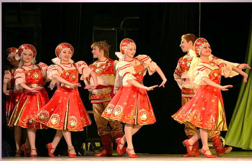
Барыня – русский народный танец

Барыня — русский народный танец, а также музыка, под которую этот танец исполняется. Общий настрой танца задорно-иронический (шутливый). При парном исполнении танцор и танцовщица танцуют попеременно (перепляс), как бы соревнуясь между собой. В основе танца лежал конфликт между "барыней" (помещицей) и "мужиком" (крестьянином). Танцовщица выражала величавость, а танцор — ловкость и удаль. Во время танца рефреном звучит фраза: « Барыня-барыня, сударыня барыня! »