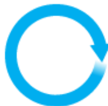
«круг»; «коло»; «колесо» – Смоленская обл. «шина» – Архангельская обл.