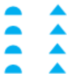
«колонна»; «шествие» – Архангельская обл.