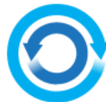
«двойной круг» или «круг в круге»